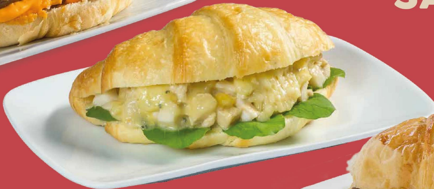
FRANGO COM CINCO QUEIJOS