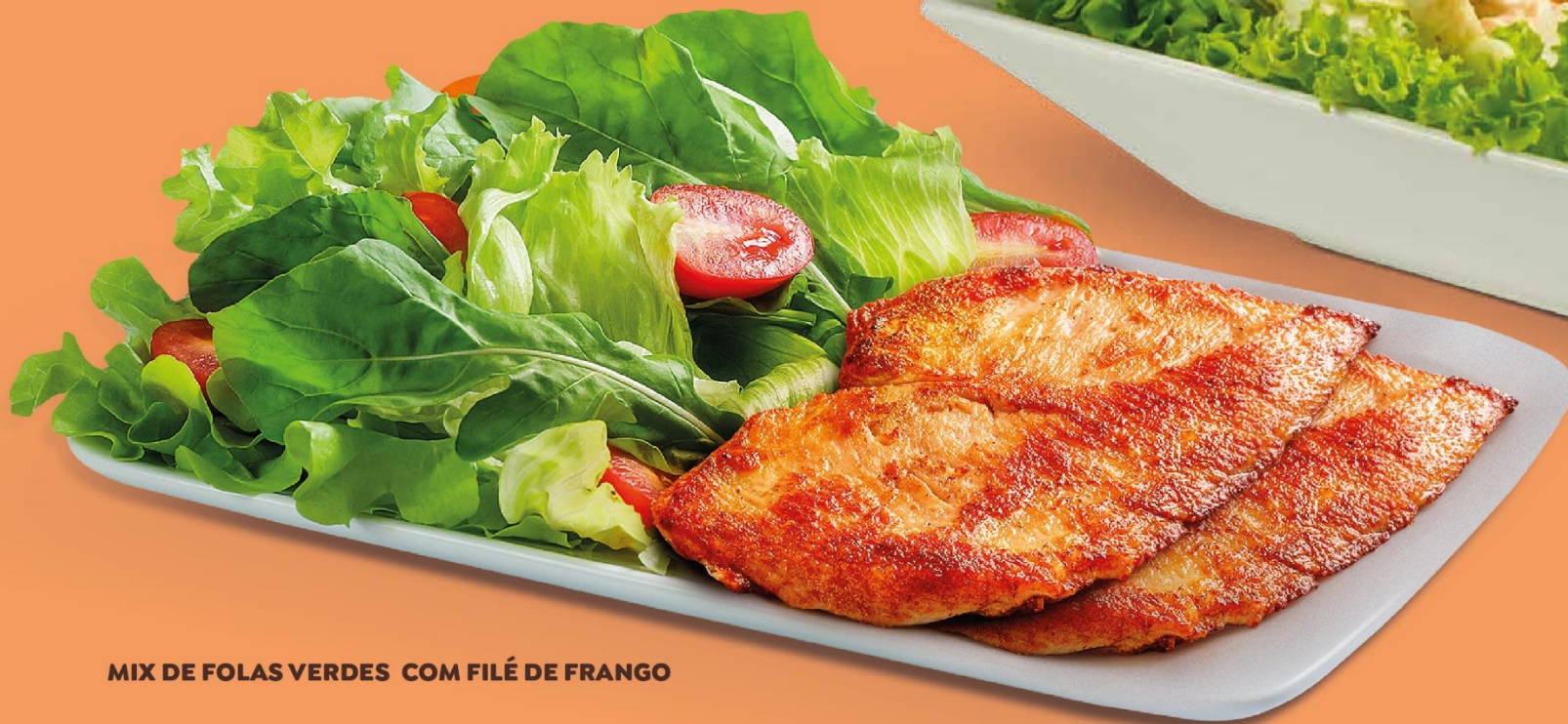
MIX DE FOLAS VERDES COM FILÉ DE FRANGO