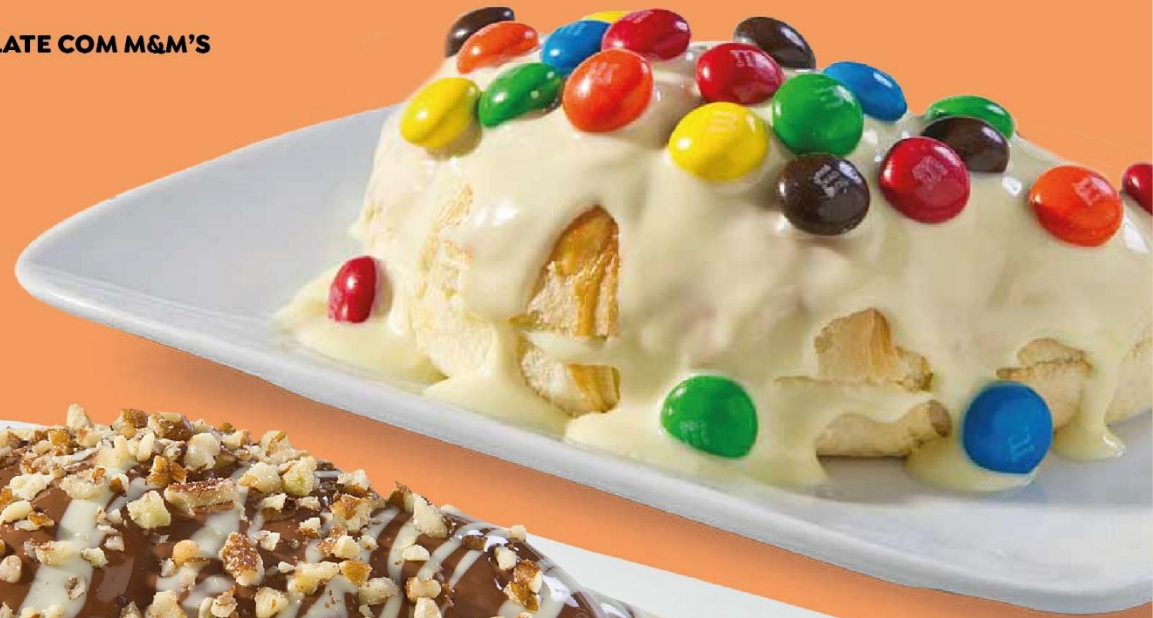
CHOCOLATE COM M&M'S