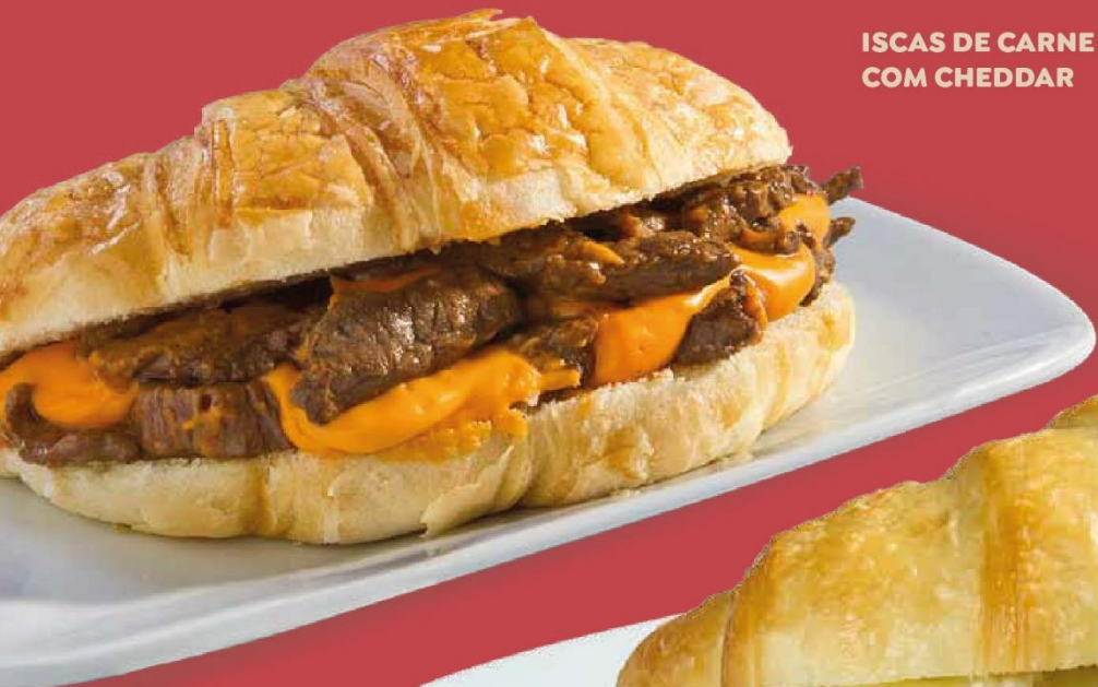
ISCAS DE CARNE COM CHEDDAR