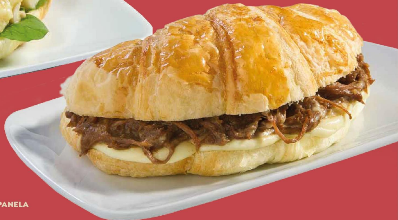
CARNE DE PANELA